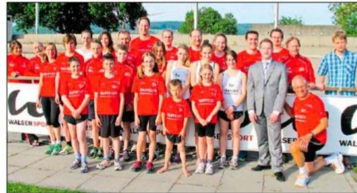
Mitglieder der Laufsportgruppe Brugg, von Walser Sport und der Raiffeisenbank mit neuem Dress versehen

Gleichsam als Belohnung für dieses jahrelange Engagement erhielt die LSG Brugg nun bei der Vergabe der 10000-m-Schweizer-Meisterschaft