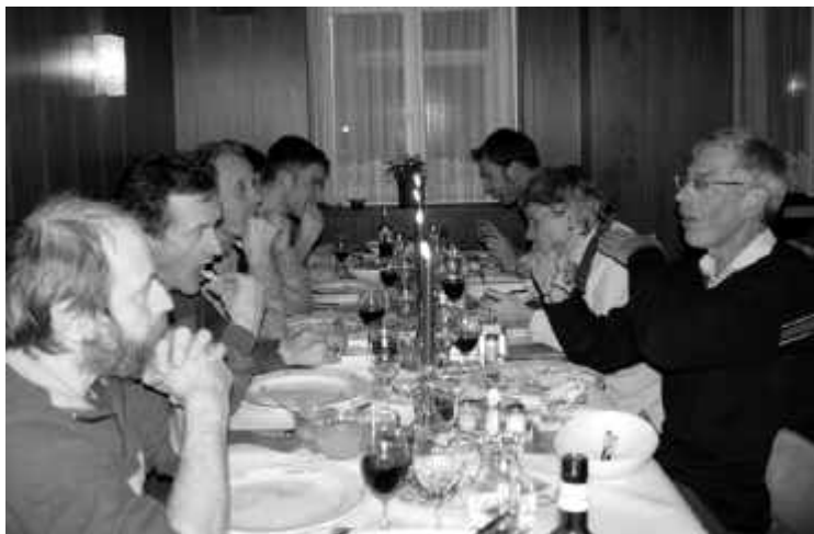
Auch der zweite (gemütlichere) Teil wurde genossen