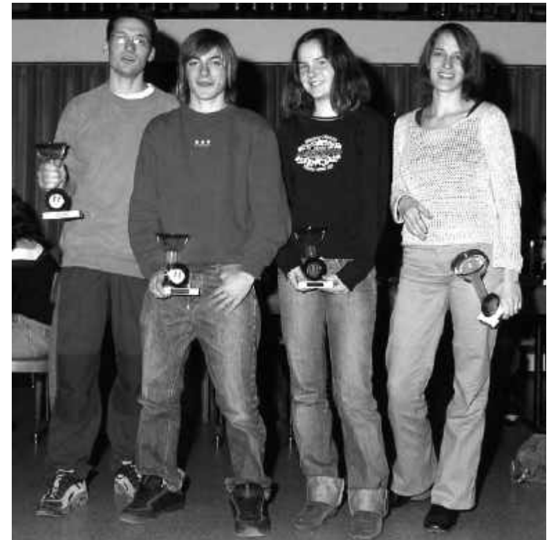
Die Gewinner der LSG-Jahresmeisterschaften 2003 an der GV im November 2003