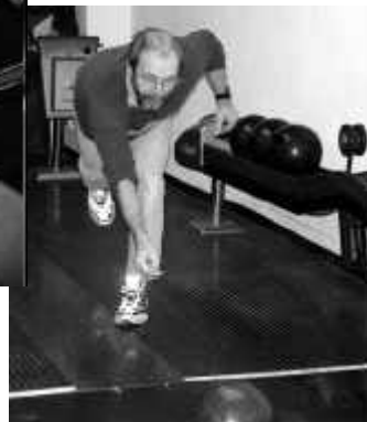
Edy mit vollem Einsatz