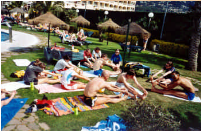
Bild links: Das obligate Dehnen am Hotelpool durfte auch dieses Jahr nach keinem Training fehlen.