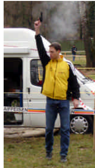
Der kurzfristig eingesprungene Starter Roger erledigte seine Aufgabe souverän.