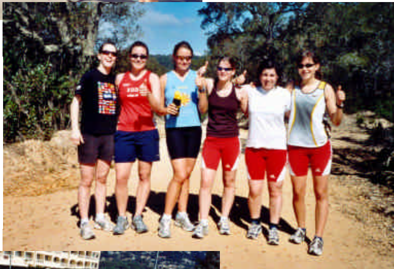
Bild rechts: Eine muntere Mädchengruppe auf einer der wunderschönen Anhöhen rund um die Stadt Lloret.