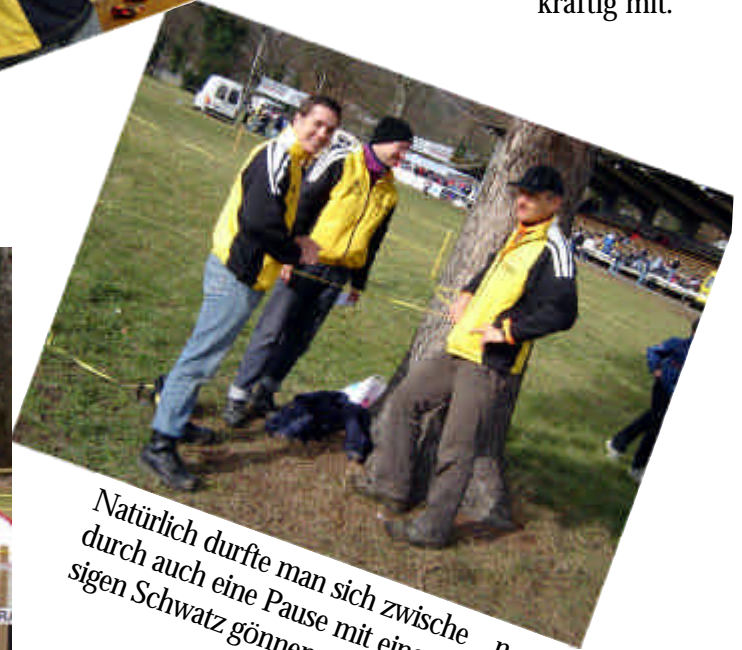
Natürlich durfte man sich zwischen durch auch eine Pause mit einem spa-sigen Schwatz gönnen.