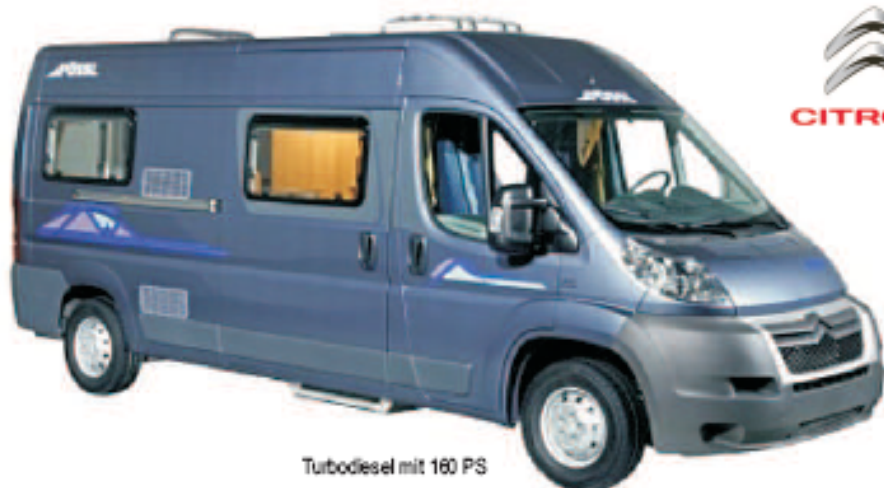
Turbodiesel mit 160 PS

Mehr Infos zur Einrichtung und zu Reservationen unter www.schmid-wohnmobile.ch