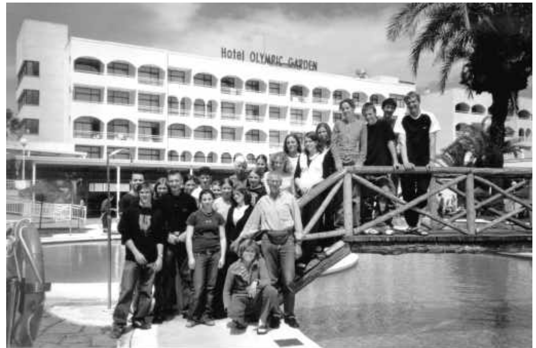
Die allseits bekannte Hotelanlage mit ihrer attraktiven Aussenanlage bot eine gute Gelegenheit, ein Gruppenfoto zu schiessen.

Die Unterkunft, die selbe wie eh und je, das Olympic Parkhotel. Das Essen ein wenig fad, doch der neu erworbene Stern hat sich ein wenig bemerkbar gemacht. >>>