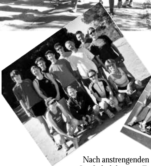
Nach anstrengenden Laufschulübungen Fototermin der zwei Laufschulgruppen