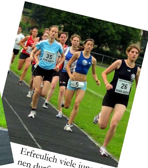
Erfreulich viele junge Läuferinnen durften zum 1500 m Lauf begrüsst werden.