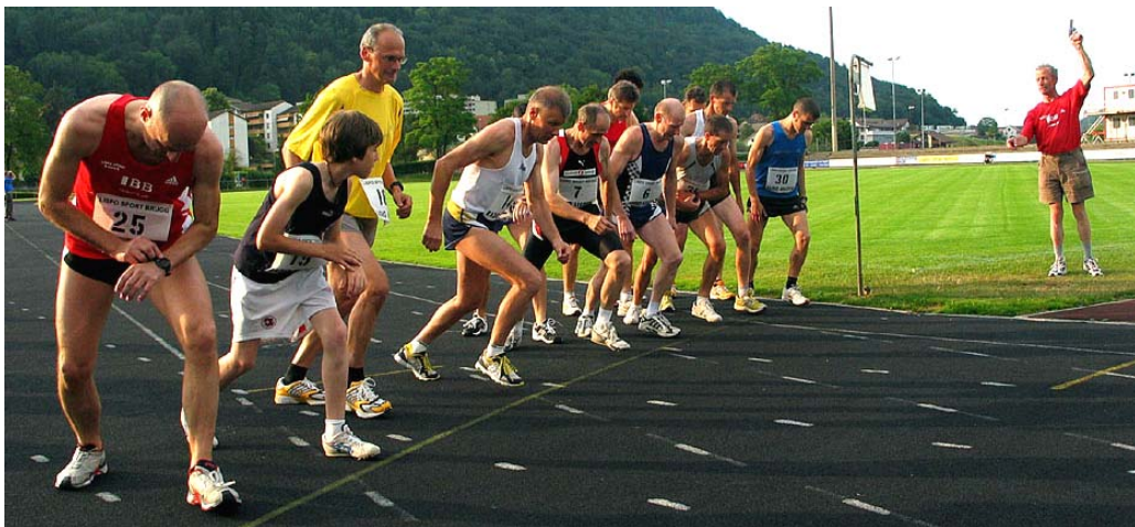
Volle Konzentration beim Start zur zweiten Serie des 12 min. Laufes.