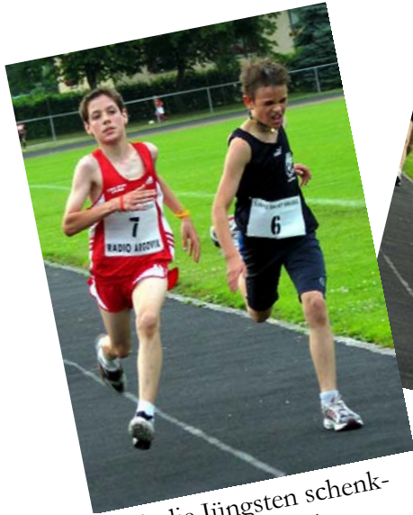
Auch die Jüngsten schenken sich nichts auf den letzten Metern.