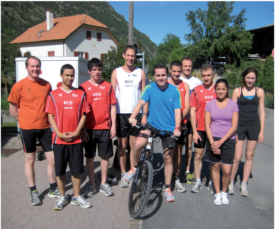
freudiges Lachen der Teilnehmer des Lagers im Südtirol