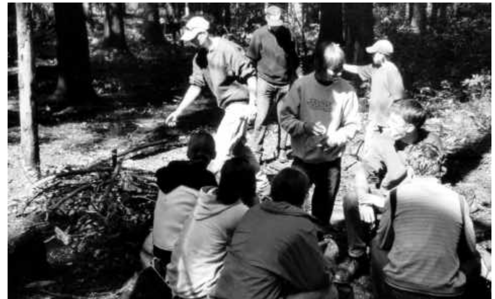
Läufer/innen versuchen ein Feuer zu entfachen, ob das wohl klappt....?