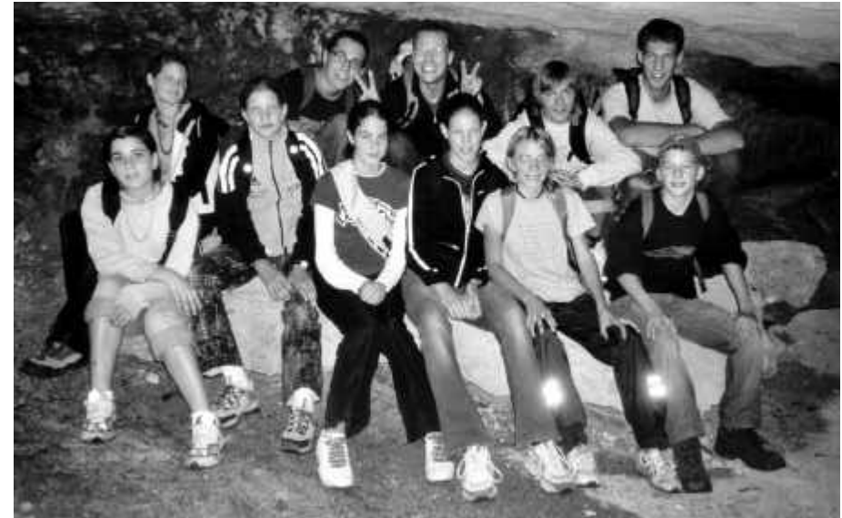
Ein Teil der Teilnehmerschar lässt sich in einer „Höhle“ ablichten