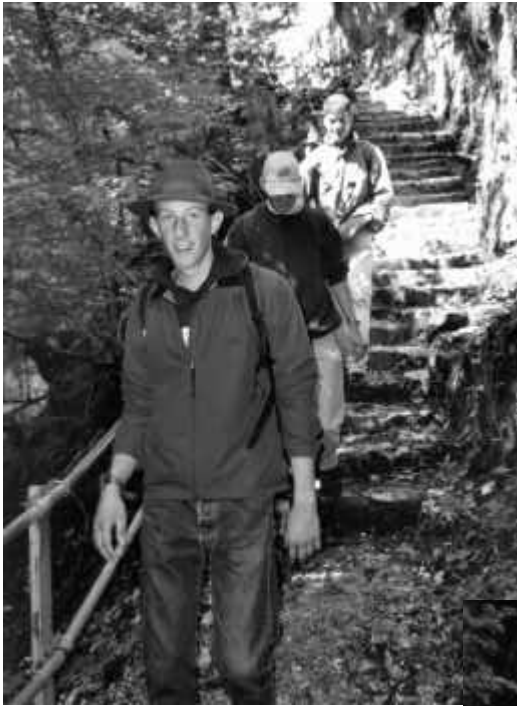
Das Wandern ist des Müllers (Jägers...) Lust...