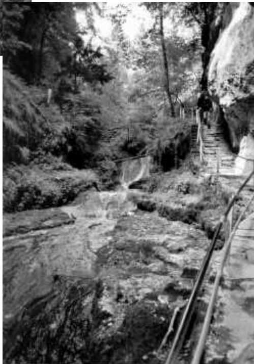
...und in einer solch schönen Umgebung wie der Twannbachschlucht macht es natürlich doppelt Spass!