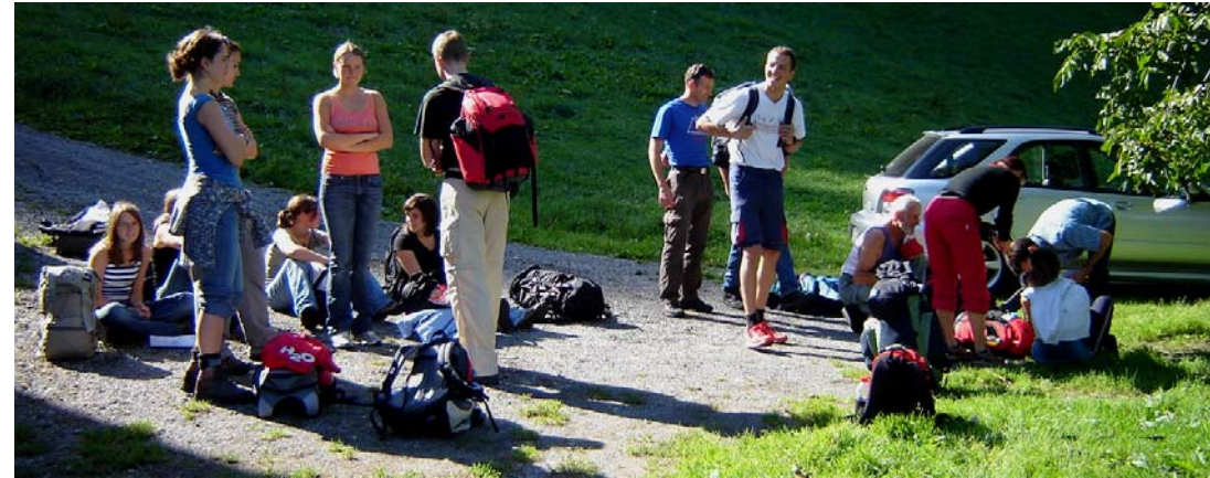
Nach dem ersten groben Anstieg gings ans Ausruhen und (rechts) ans Pflegen der ersten Blasen.