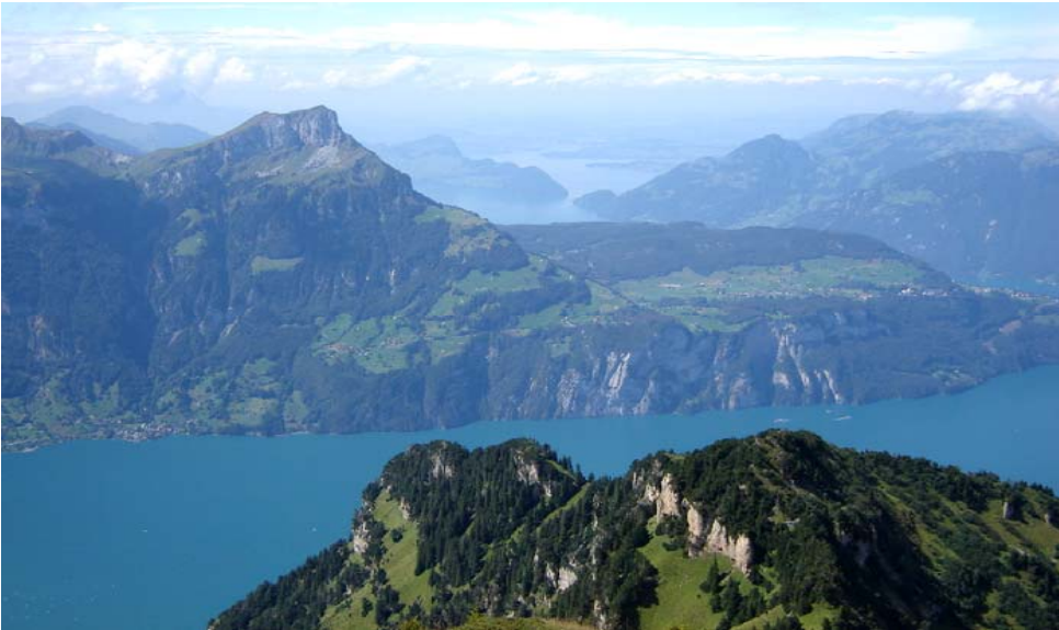
Schon nur für diese Aussicht lohnte sich die Teilnahme an der Vereinsreise.