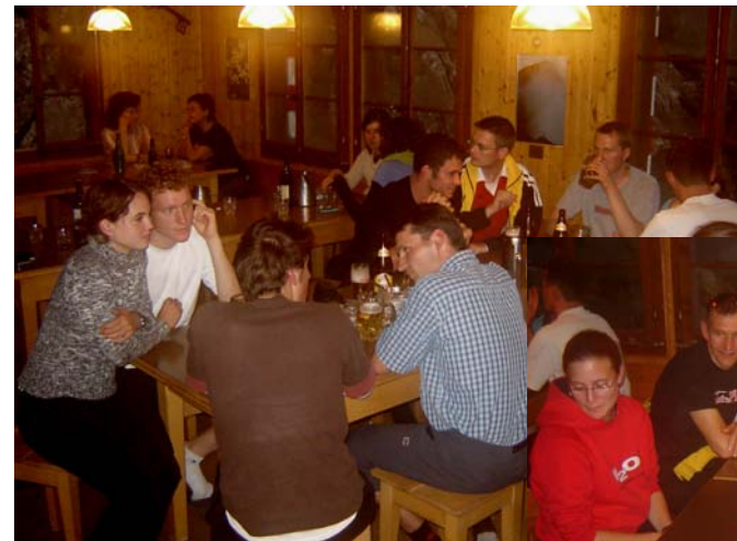
Gemütliches Beisammensein in Trockenheit und Wärme in der Lidernenhütte.