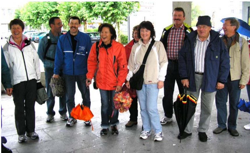
Trotz des schlechten Wetters gute Stimmung: Den Freunden aus Deutschland machte das Treffen sichtlich Spass.