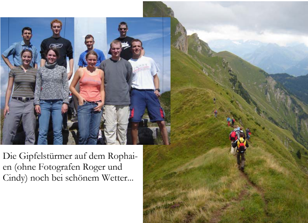
Die Gipfelstürmer auf dem Rophaien (ohne Fotografen Roger und Cindy) noch bei schönem Wetter...