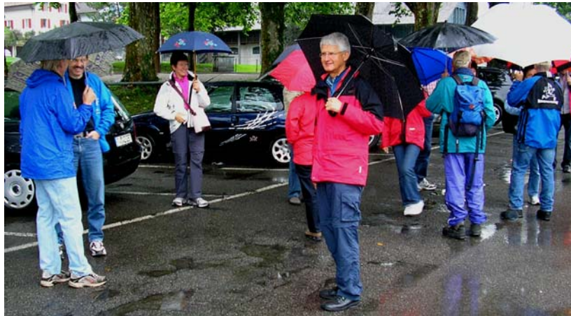
Der Schirm stellte an diesem Tag des Hauptutensil jedes Teilnehmenden dar.