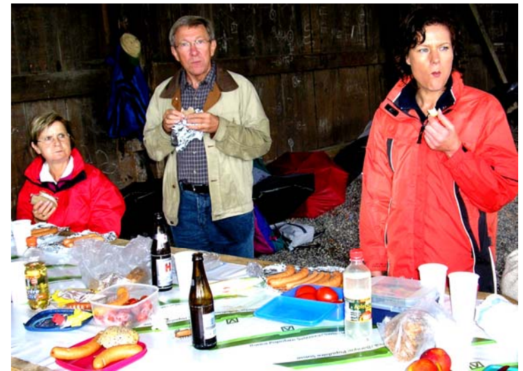
Die Stärkung nach dem Marsch war redlich verdient.