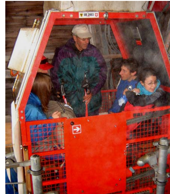
Nasskalte Talfahrt in origineller Gondel (eigentlich nur für vier Personen konzipiert...)