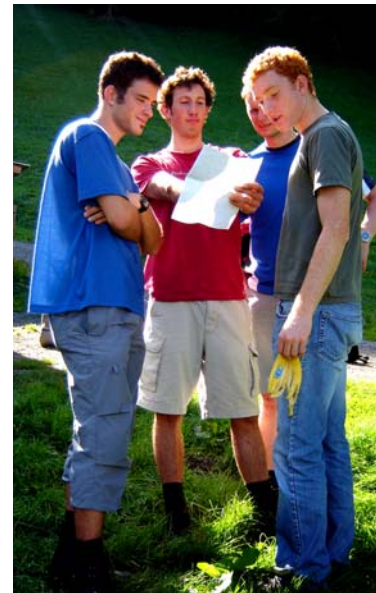
Eine seriöse Routenplanung war gefordert.