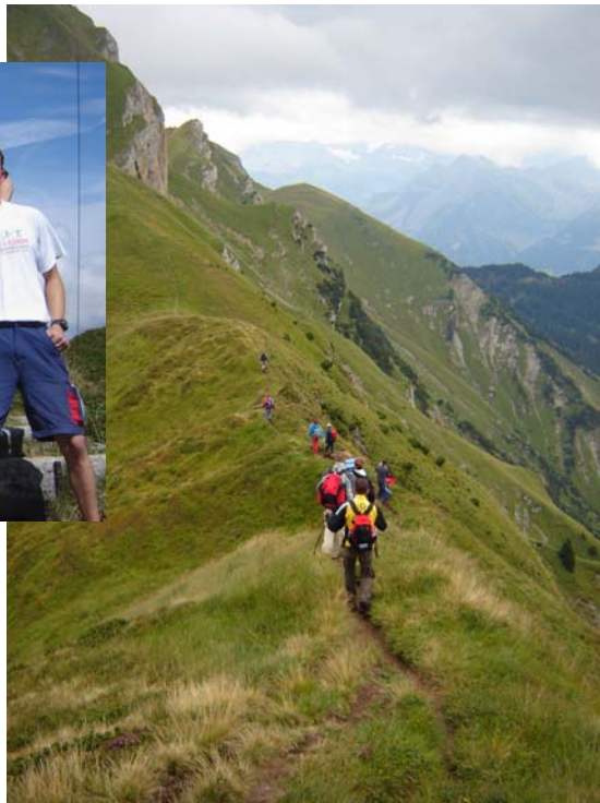
...und bei zunehmend schlechter Witterung auf schmalen Grat Richtung SAC-Hütte.

Währenddessen kämpften wir, die übrig gebliebenen, uns unter Schweiß und brennenden Muskeln, dem Rophaienkreuz empor. Müde aber glücklich genossen wir auf 2078 m.ü. M. das herrliche Panorama.