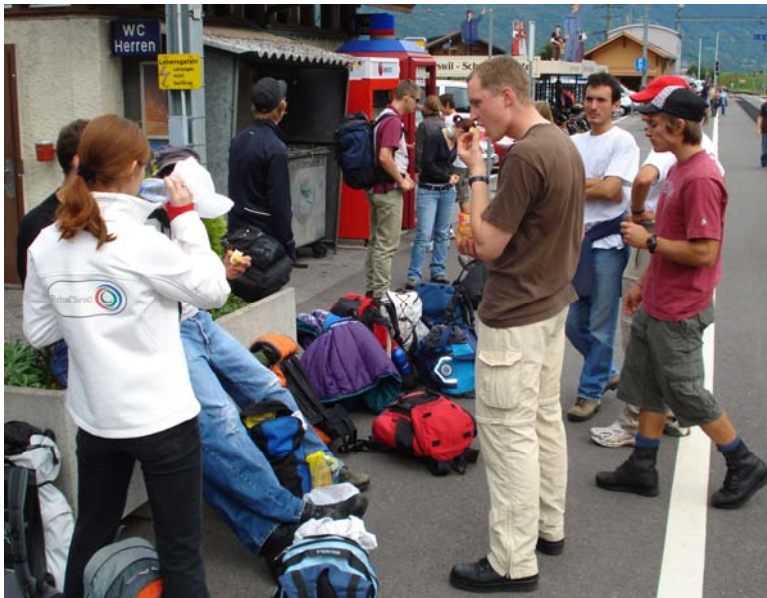
Letzte Stärkung(en) vor dem Abmarsch Richtung Faulhorn