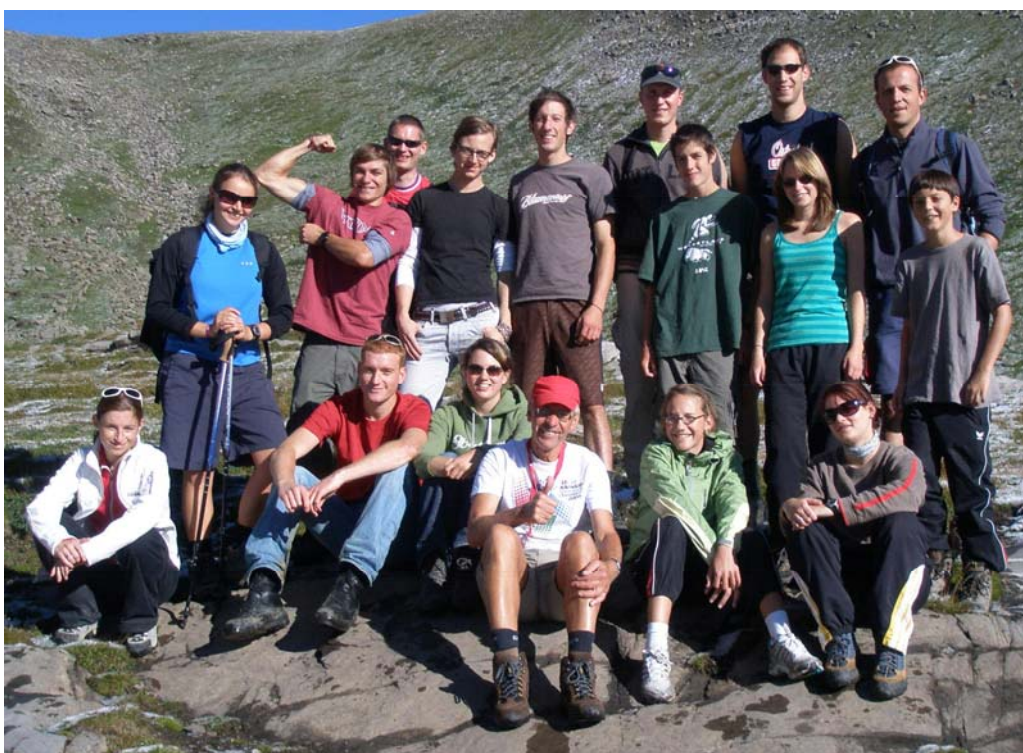
Die muntere Gruppe posierte vor Jesus' Linse